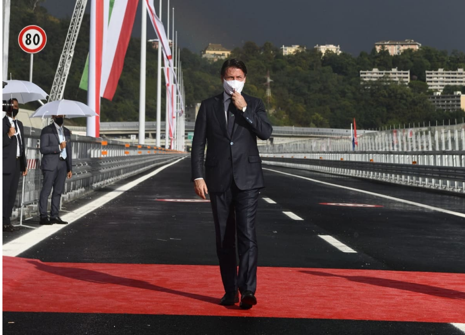
Прем'єр-міністр Італійської Республіки Джузеппе Конте на церемонії відкриття мосту

https://metinvestholding.com/ua/media/news/v-italii-otkrili-most-iz-stali-metinvesta