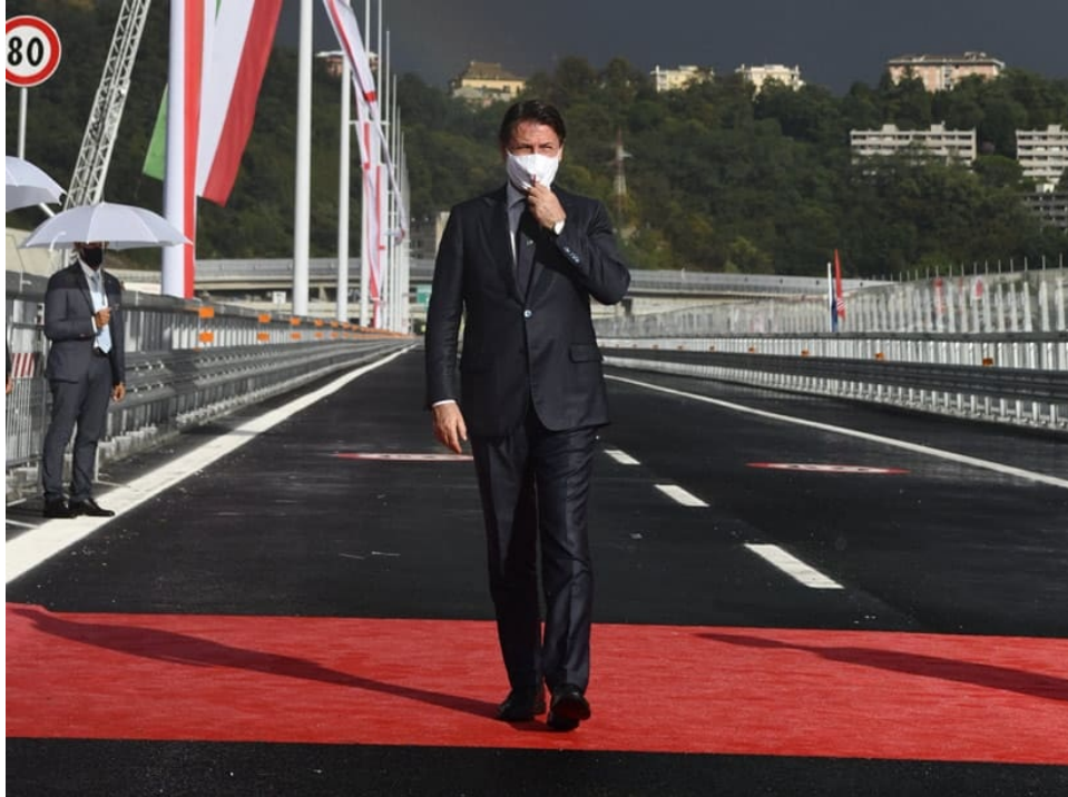
Премьер-министр Итальянской Республики Джузеппе Конте на церемонии открытия моста

https://metinvestholding.com/es/media/news/v-italii-otkrili-most-iz-stali-metinvesta