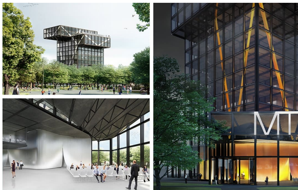
Скачати візуалізацію будівлі

У Маріуполі для Метінвест Політехніки та його студентів побудують навчальний корпус і кампус за дизайн-проектом нідерландського бюро MASA Architects архітектора Хірокі Мацуури, відомого своїми роботами в низці країн світу. Корпус університету буде побудовано за найсучаснішими технологіями зі сталі Метінвесту. Завдяки будівництву нового вишу в Маріуполі буде реконструйовано міський сад – одне з улюблених місць відпочинку містян. Місто також отримає сучасний реконструйований стадіон «Азовець».