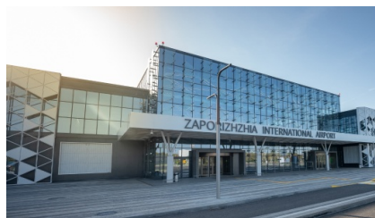
Новий термінал міжнародного аеропорту Запоріжжя.

У реконструкції універмагу використано 2.000 тонн сталі виробництва ММК імені Ілліча та Азовсталі