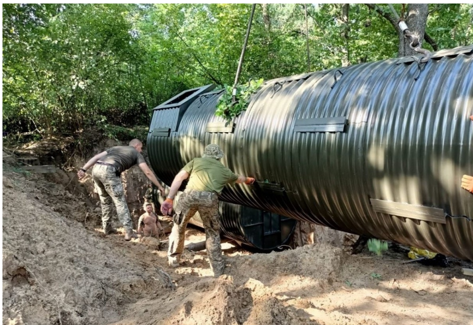
Мобільні «криївки»

Мобільні «криївки», які слугують воїнам укриттям, не лише виробляються із сталі Metinvestу, а є ще й власною розробкою спеціалістів компанії.