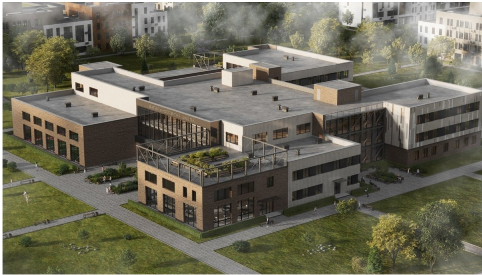
Концепція будівлі школи / «Сталева мрія», Metinvest

Та Метінвест не полишає надії, що в Маріуполі сталеве житло таки з'явиться. У компанії розробили проєкт житлового кварталу площею 34 га в Лівобережному районі міста. Планується, що житлова забудова займе близько 7 га, громадська — 3 га. Будинки будуть різної висотності — від одного до восьми поверхів — і багатосекційними, також заплановані приватні садиби. Квартал розрахований на понад 10.000 мешканців.