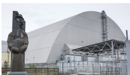
Саркофаг над Чорнобильською АЕС.

Використано 700 тонн сталі виробництва комбінату Азовсталь. Скляний міст, відкритий у 2019 році, з'єднав Володимирську гірку з Аркою Свободи українського народу