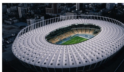
Столицький НСК Олімпійський