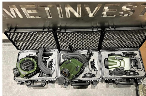
Недавно военные получили новое дефицитное оборудование от Метинвеста – 15 спутниковых артиллерийских комплексов по наведению огня

Спасать жизнь защитников на фронте помогают более 31 тысячи аптечек и кровоостанавливающих турникетов.