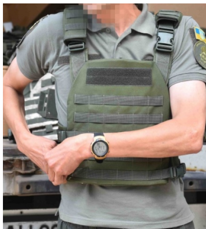
Защитные пластины для бронежилетов стали одним из первых проектов инициативы

С начала войны Метинвест системно помогает государству в различных направлениях. Стальной Фронт Рината Ахметова — масштабный частный проект помощи украинской армии. Метинвест и другие предприятия холдинга SCM разрабатывают и поставляют военным модернизированные бункеры, бронезащиту, средства РЭБ, транспорт, дроны, фортификации и другое жизненно необходимое оснащение. Основа работы — постоянный контакт с передовой.