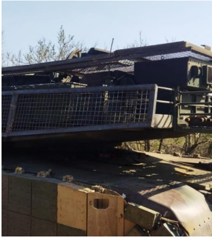
Стальные анидроновые экраны для различных видов техники повышают ее живучесть в условиях интенсивных боевых действий