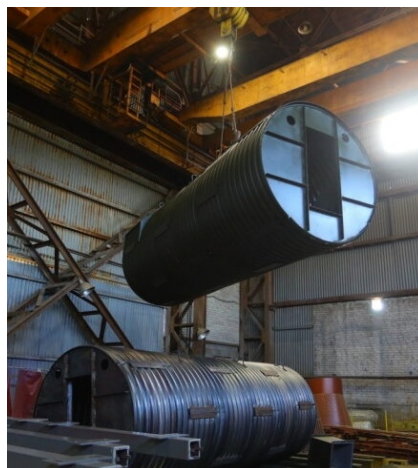
Бункеры-убежища различных конфигураций используются как укрытия для личного состава и пункты управления