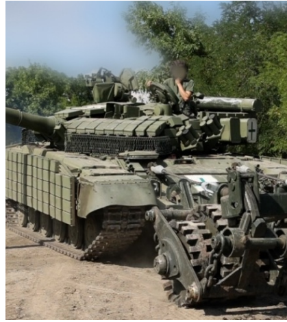
Противоминные тралы помогают танкам безопасно преодолевать заминированные участки