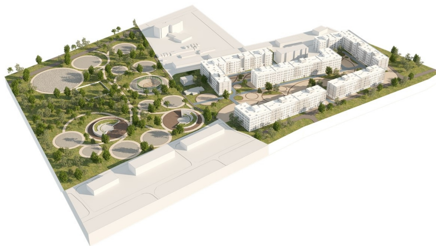
«Стальная мечта. Глухов»