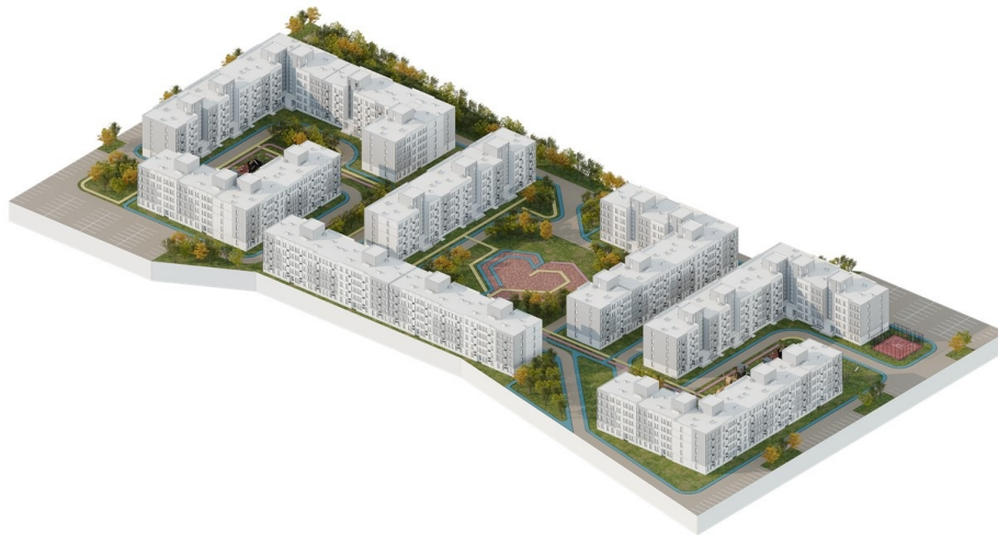
«Стальная мечта. Мариуполь-Васильков»

Концепция восстановления страны «Стальная мечта» содержит набор готовых решений для строительства жилья, социальной и коммерческой инфраструктуры. Громада может выбрать проект, адаптировать его под свои потребности, привлечь средства и сразу приступить к строительству. Специалисты разработали более 200 готовых проектов зданий на основе трех стальных предварительно изготовленных элементов: каркаса, модуля и платформы. Проекты содержат полный пакет документов: смету, графики строительства, планировку и технические решения. Проектом «Стальная мечта» управляет компания Метинвест Сичсталь, занимающаяся стратегическими инвестиционными проектами Группы Метинвест.